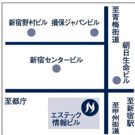
新宿エステックビル店

月～土 7:00-22:00 日祝日 7:30-22:00 禁煙 55席 / 加熱式たばこ専用喫煙席 29席